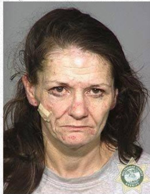
3 years, 5 months later