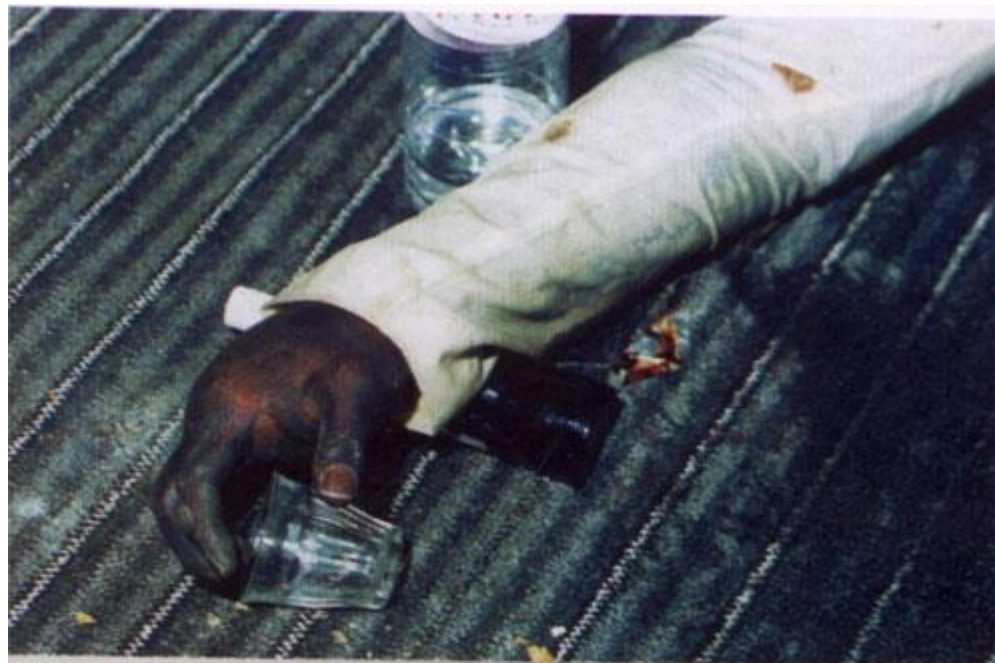
شباب وجد متوفي داخل منزل إثر تعاطيه الهيروين والكحول ويتضح بالصورة يده وهي متفحمة جراء التعاطي