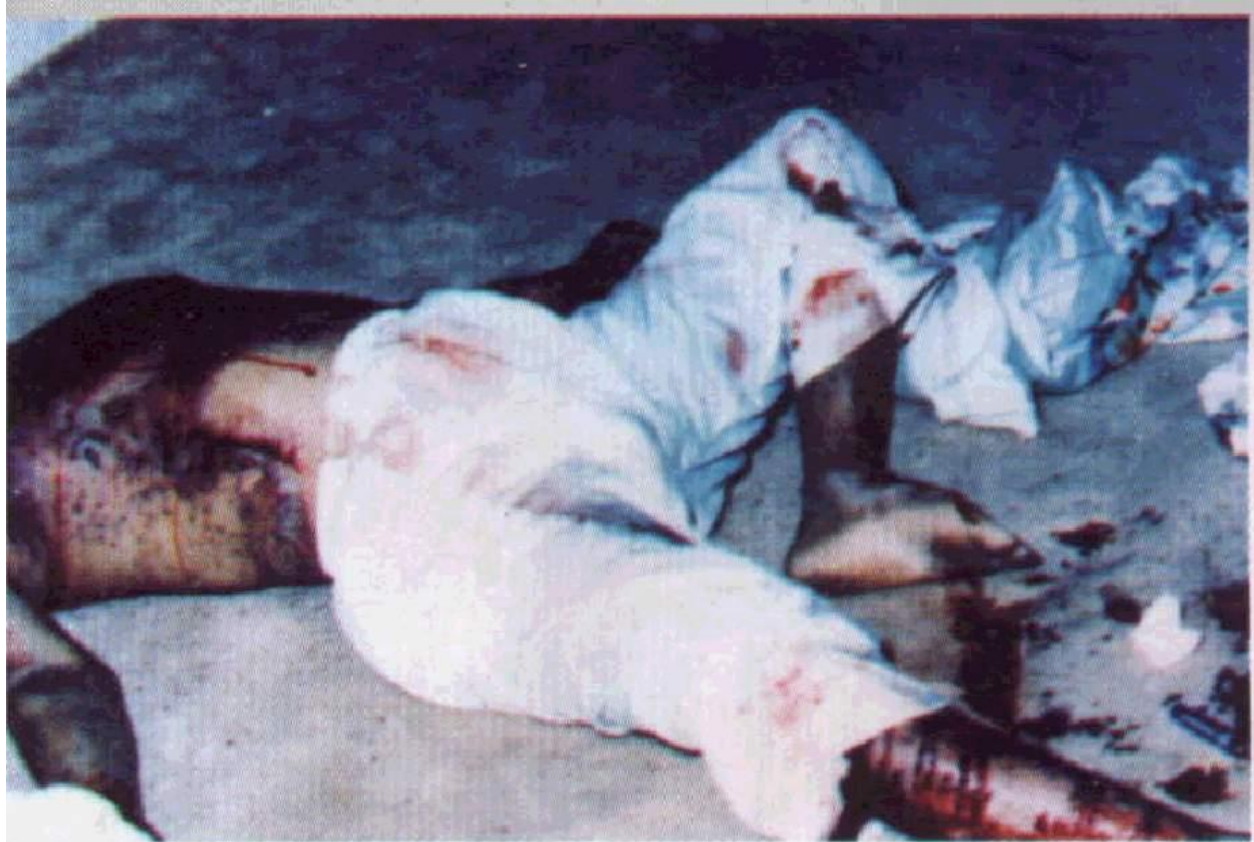
رجل عمره ٣١ عاماً وجد متوفي إثر تعاطيه المخدرات ويتضح انفجار الشرايين