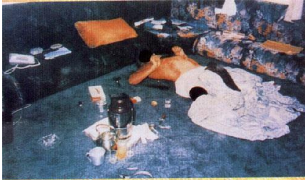
رجل عمره (٥١) عاماً وجد متوفي داخل منزله لتعاطيه الهيروين